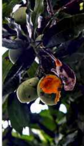
Salah satu buah mangga yang sudah terjual di pasar di Banda Aceh.

Merajut mimpi sepeda motor listrik di Banda Aceh.