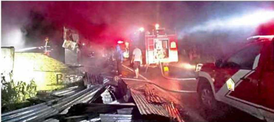
PADAMKAN API - Pasukan pemadam kebakaran desa mendarat di api yang merambat di rumah warga Kampung Paya Kolak, Kecamatan Celaka, Aceh Tengah, Senin (09/02/2023) menjelang subuh.