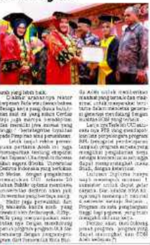
Salah satu kegiatan di UII.

BANDA ACEH - Universitas Islam Indonesia (UII) yang mengadopsi pendekatan berbasis teknologi dan digitalisasi diharapkan mampu bersaing di era digital. "Kita akan berfokus pada pengembangan perikanan di Aceh," katanya.