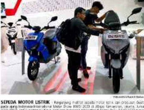
Salah satu bengkel sepeda motor listrik di Banda Aceh.

beras, Aceh Besar, sebanyak 6.000 ton. Selain itu, dua hari lagi akan masuk beras impor ke Aceh dari Vietnam sebanyak 7.000 ton melalui Pelabuhan Krating Gerbang Lingsar. "Total beras impor yang masuk ke Aceh dari luar negeri sampai Februari 2023, katanya, mencapai 29.500 ton. Sedangkan yang sudah didistribusikan dari jumlah itu, katanya, mencapai 23.500 ton. "Kita optimis, akan ada beras impor ke Aceh untuk kebutuhan pangan lokal dan untuk ekspor," katanya.