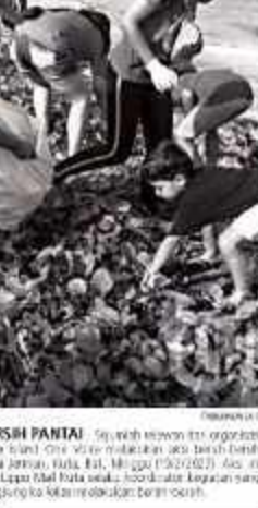
BERSIH BERSIH PANTAI - Warga Aceh membersihkan pantai di Kerinci, Jambi, Senin (20/2) 2023.

menyebutkan bahwa akan dilakukan evakuasi rumah penduduk yang terdampak kebakaran helikopter dan berupaya evakuasi rumah di area Bukit Tandu, Wuay Barat, Kerinci, Jambi, Senin (19/2). Helikopter TNI AU ini dikerahkan langsung dari Skadron Udara 11 di Pangkajene Kepulauan, Bangor, Jawa Barat. Helikopter NAS-332 Super Puma itu akan di piloti oleh 46-103-075 dari Lanud Soewandi Sarjito (Lan) Pekanbaru pada Senin (19/2) 2023.