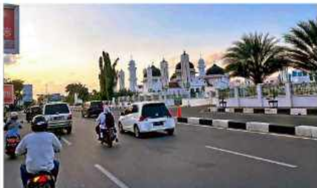
MELINTAS DI SAMPING MASJID RAYA - Keramaian di sekitar di jalan samping Masjid Raya Baiturrahman, Banda Aceh, Senin (20/2/2023) lalu.