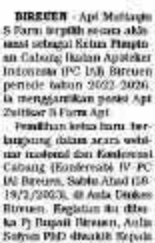
Muttaqin Ketua Ikatan Apoteker Bireuen

Apoteker Bireuen, Muttaqin, mengatakan bahwa pihaknya akan melakukan berbagai kegiatan untuk meningkatkan kualitas pelayanan kesehatan masyarakat.