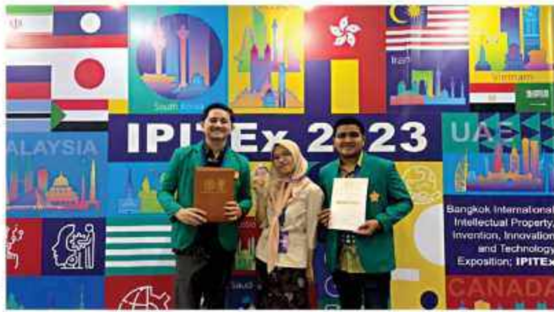
FOTO BERSAMA Tiga mahasiswa Universitas Sains Kuala Lumpur (USK) Banda Aceh, Ibu bersama di ajang Bangkok International IPITex 2023, yang diadakan The National Research Council of Thailand (NRCT), 2-6 Februari 2023.

Empat orang tidak pernah menyangka akan meraih perunggu di ajang Bangkok International Intellectual Property, Innovation and Technology Exposition (IPITex) 2023 dan meraih 470 ribu dari 24 negara. Berkatannya hasil karya yang berjudul proposal yang sudah diujikan, tim USK berhasil meraih nilai perunggu terbaik untuk tiga orang peneliti muda dari Aceh perwakilan karya.