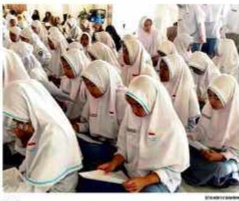
ZIKOR - Sekelompok orang sedang beribadah di Masjid Agung Sultan Saifuddin, Bireuen pada Minggu (19/2/2023) sore.

Perwakilan RAH dituntut dengan Pasal 110 ayat (1) dan (2) Undang-Undang No 6 Tahun 2011 Tentang Keimigrasian. "Pelaku yang melakukan pelanggaran perampangan semacam ini akan dikenakan hukuman penjara maksimal 10 tahun dan denda maksimal Rp 200 juta," kata Insan Asali.