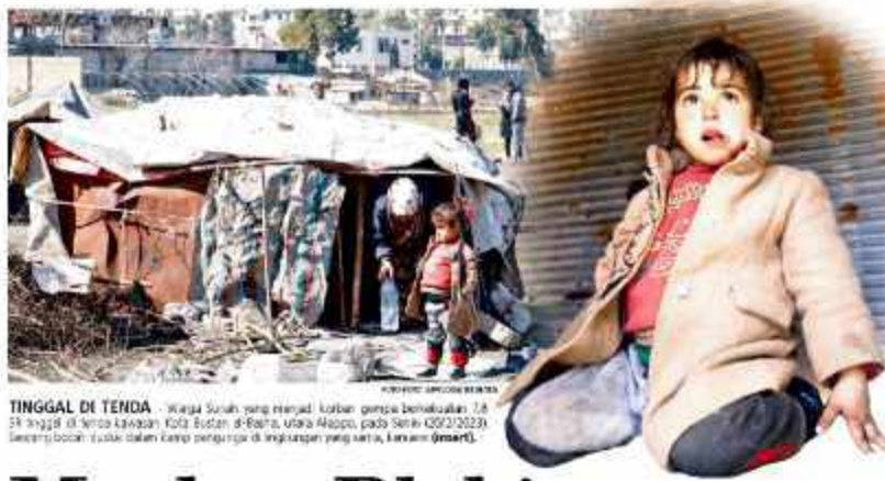
TINGGAL DI TENDA Warga Suruh yang tinggal dalam gempok bermukiman. Ia tinggal di tenda di kawasan Kota Suruh, di Pantai, utara Aceh, pada Senin (20/2/2023). Berencana pindah rumah dalam tempo penghapusan kamp suruh, Liris.com (@mrtk).