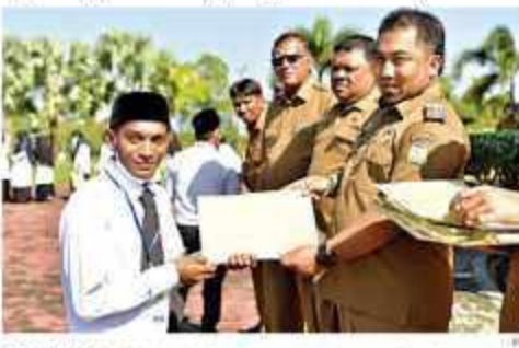
SERAHKAN SK - Kepala Kantor Wilayah Dinas Pendidikan dan Kebudayaan Aceh, Saifullah Yusuf (kiri) menyerahkan SK Perpanjangan Perjanjian Kerja (SK-PPPK) kepada 194 guru PPPK di Jantoh, Aceh, Senin (20/2/2023).

"Diharapkan, perpanjangan perjanjian kerja ini akan meningkatkan kesejahteraan dan produktivitas pegawai," ujar Kepala Dinas Pendidikan dan Kebudayaan Aceh, Saifullah Yusuf, Senin (20/2/2023).