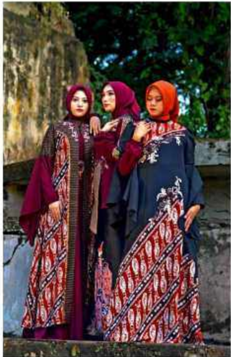
Salah satu batik Khas Kutai Timur.

Langkah ketiga adalah memperkuat koordinasi kebijakan dengan pemerintah pusat dan pemerintah daerah. Langkah keempat adalah memperkuat koordinasi kebijakan dengan BI.