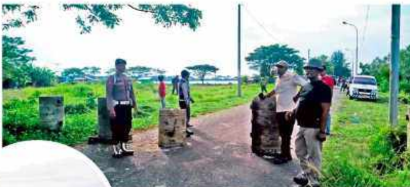
JALAN KE WADUK DITUTUP – Sejumlah petugas menutup akses jalan ke lokasi Waduk Hanyu, Kecamatan Bayu Kota Lhokneumawe guna memperbaiki bangunan di 3 daerah itu, dalam waktu 3 bulan.

Sementara itu di sisi lain, ada beberapa tenaga honorer Murnas yang langsung diberikan loker dan dipergang kembali, tetapi harus menunggu ujian esai dan tes wawancara. Mervia sudah janji, setiap PP, setiap tenaga kepegawaian, petugas penerimaan, dan tenaga administrasi. (b)