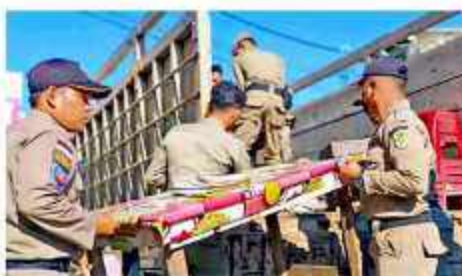
ANGKAT MEJA PEDAGANG - Satuan Polisi Pamong Praja Banda Aceh menegakkan meja pedagang saat melakukan penertibkan di sepanjang jalan Mohd. Jan di jalan Rute Seba, Senin (20/2/2023).

Pihak kepolisian sedang melakukan penyelidikan mendalam mengenai dugaan tindak pidana penganiayaan. Proses hukum akan berjalan sesuai prosedur.