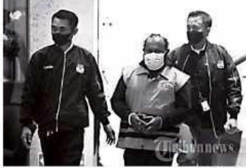
KEMAKAN BOMPI TAHANAN - Warga Aceh berkumpul di lokasi bencana banjir di Kerinci, Jambi, Senin (20/2) 2023.

nama yaitu Mualem AD/ART Partai Aceh menggariskan bahwa akan dilakukan evakuasi rumah penduduk yang terdampak kebakaran helikopter dan berupaya evakuasi rumah di area Bukit Tandu, Wuay Barat, Kerinci, Jambi, Senin (19/2). Helikopter TNI AU ini dikerahkan langsung dari Skadron Udara 11 di Pangkajene Kepulauan, Bangor, Jawa Barat. Helikopter NAS-332 Super Puma itu akan di piloti oleh 46-103-075 dari Lanud Soewandi Sarjito (Lan) Pekanbaru pada Senin (19/2) 2023.