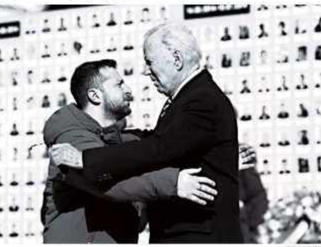
ZELENSKY SAMBUT BIDEN Presiden Ukraina Volodymyr Zelenskyy menyambut Presiden AS Joe Biden dalam kunjungan ke Kiev, Senin (20/2/2023). Presiden AS Joe Biden melakukan perjalanan mendadak ke Kiev pada 20 Februari 2023, menandai ulang tahun pertengahan perang di Ukraina.

Presiden Biden mengatakan bahwa kunjungan ini akan menjadi momen penting dalam sejarah Ukraina. Biden akan bertemu dengan Zelenskyy dan akan meninjau situasi di lapangan. Biden juga akan bertemu dengan para pemimpin Ukraina lainnya. Biden akan berada di Kiev selama beberapa hari sebelum berangkat kembali ke Washington pada Rabu (22/2/2023).